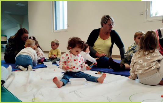
Montreuil-Poulay - atelier d'éveil plastique et musical