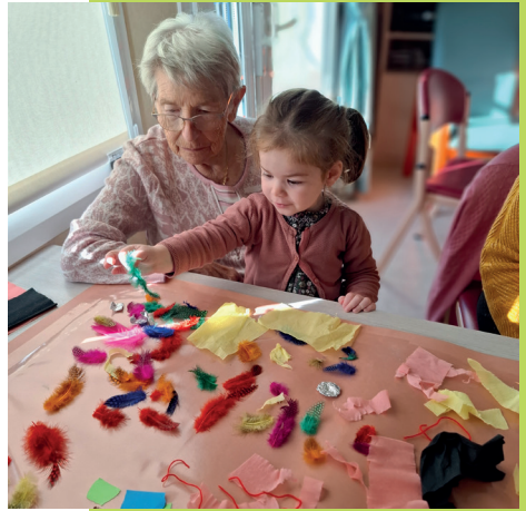
Mayenne - Résidence autonomie