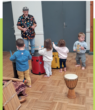
Charchigné - découverte des percussions