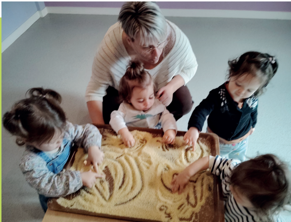
Marcillé - Atelier d'éveil plastique et musical